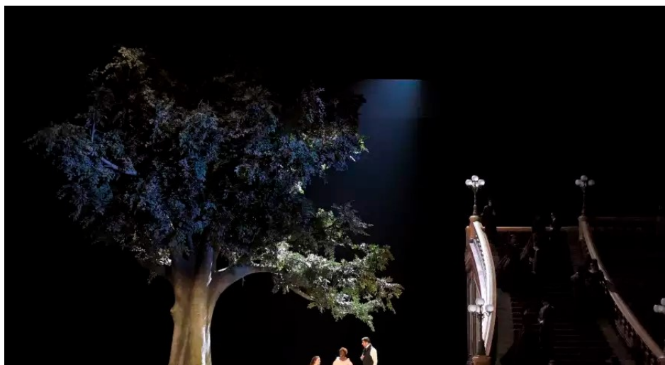
Foto della monumentale Traviata di Benoît Jacquot all'Opéra Bastille